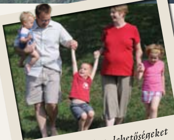
A programokat, lehetőségeket mindig megbeszéljük a gyerekekkel, és közösen döntünk

– Nem könnyű, de megoldható a választás. A feleségem és én inkább a hegyeket és a várakat részesítjük előnyben. De mint mondtam, egyelőre olyan úti célokat választunk, amelyek a gyerekek számára vonzó-