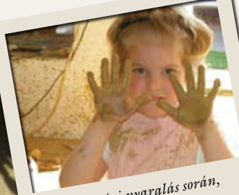
Az órségi nyaralás során, az egész család „fazekasinak” szegődött

– Gondolom, ezek a (majdnem) testközeleli élmények többet jelentettek a gyerekeknek, mint majdan jó néhány élővilágóra, amelyeken könnyből tanulják meg, milyen a ló vagy a szarvasmarha közelről, vagy miben különbözik a liba a kacsától.