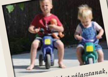
Olyan úti célokat választanak, amelyek a gyerekek számára is érdekesek

– Tudatos volt, természetesen. Amikor a feleséggel még nem voltunk házasok, és jegyesekként terveztük közös életünket, arról beszélgettünk, hogy annyi gyermeket szeretnénk, amennyit türelemmel, szeretettel és energiával körül tudunk venni. Nagyon örülünk annak, hogy immár a negyedik gyermek érkezik a családukba. Nekem egy öcsém van, viszont a feleségemnek négy testvére, tehát nem ismeretlen a nagycsaládos életforma. Nem szeretnénk heroikus küzdelmet folytatni sem az idővel, sem önmagunkkal, úgy gondol-