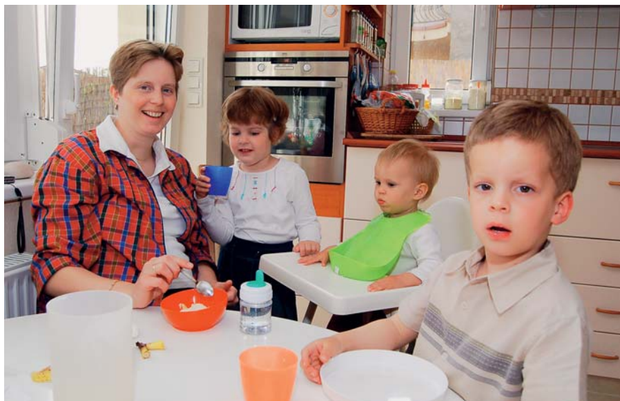
Konyhai idill – „a gyerek nem pillanatragasztó, párok egyben tartására kifejlesztve”

nek gyerekeink, akkor is család lennénk. A szlogen azt sugallja, hogy egy kapcsolatot a gyerek tart össze. Holott ez hamis illúzió; mi vagyunk a központ, a gyerek pedig ajándék. Sokkal jobbnak látnám mondjuk a „Megköszönni, felnevelni, elengedni” mondatot. A gyerek ugyanis nem juss, nem jog, akit valamiért megérdemlünk. A gyereket a Jóisten adja kölcsönbe, nekünk tehát az a dolgunk, hogy megköszönjük. Az a dolgunk, hogy a lehető legjobb lelkiismeretünk szerint felneveljük. És előbb-utóbb el fogja hagyni a családját, hogy sajátot hozzon létre. Akkor pedig az lesz a dolgunk, hogy elengedjük őt. Persze „pici elengedések” a megszületésétől fogva tetten érhetők, folyamatosan csökken a szerepünk. Szembesülnünk kell azzal, hogy nem a tulajdo-